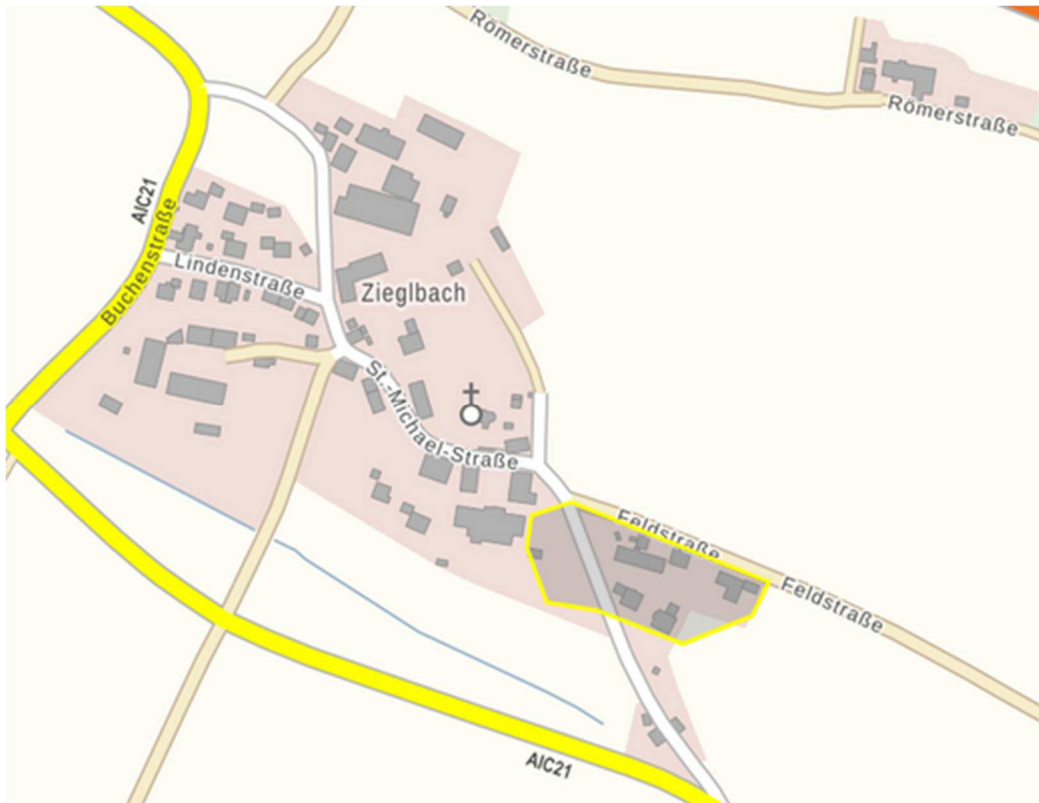
Abbildung 7 Ortsteil Zieglbach