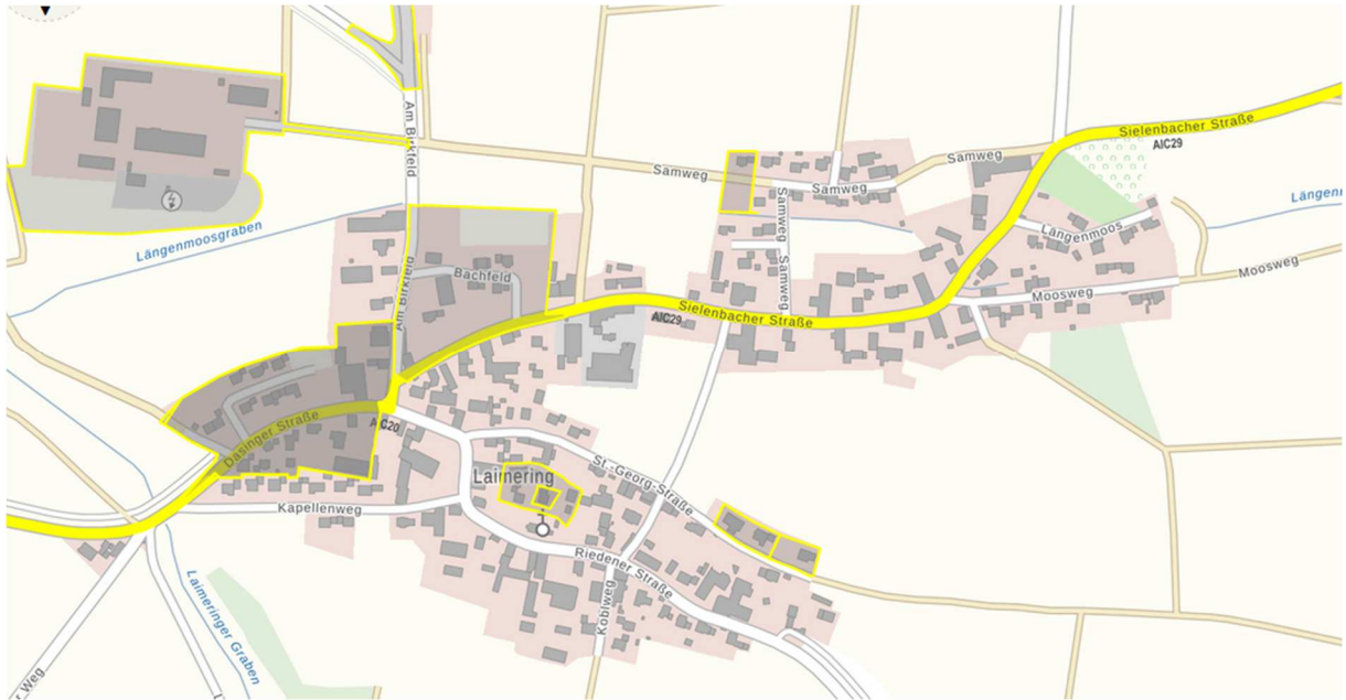
Abbildung 3 Ortsteil Laimering