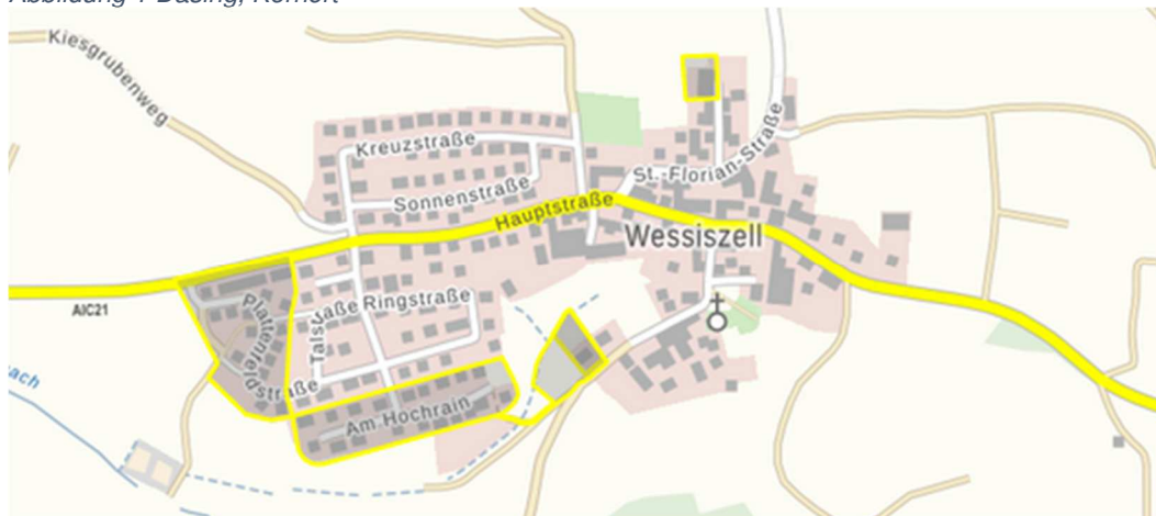
Abbildung 2 Ortsteil Wessizell