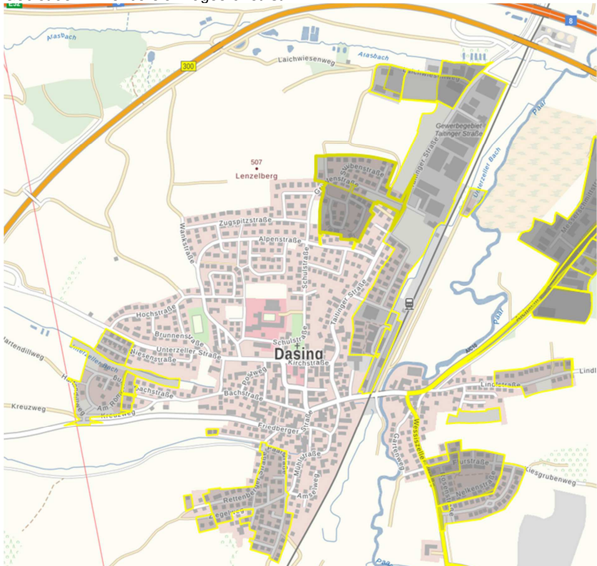
Abbildung 1 Dasing, Kernort

Gelb umrandet und grau hinterlegt, sind Bereiche, in denen eine Planung erfolgte. Hierbei sind auch Ortsrandsatzungen eingeschlossen, in deren Geltungsbereich das Gebiet dem Innenbereich zugeordnet ist.