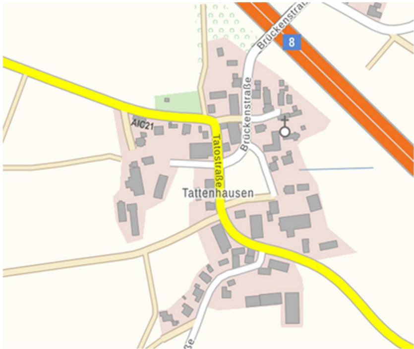
Abbildung 6 Ortsteil Tattenhausen