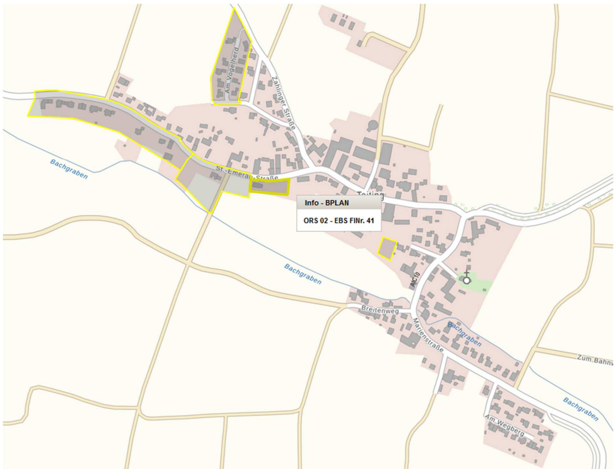
Abbildung 4 Ortsteil Taiting